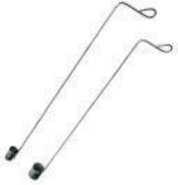
Dipper: sıvı azot alımı için kepçe