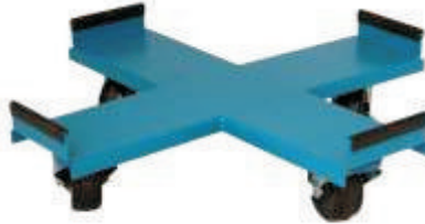
20 litre ve daha büyük Dewar'ların kolayca hareket ettirilmesini sağlayan Roller Base