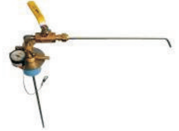
LN2 Aktarım Ünitesi: Sıvı azot aktarımı için güvenli ve etkili bir method