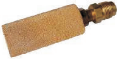
Faz Separatörü – ¼ inch