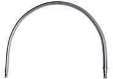
Transfer hattı: Sıvı azotun bulk depolama tanklarından daha küçük Dewar'lara transferinin güvenle yapılması sağlayan, vakumsuz 2m esnek transfer hat