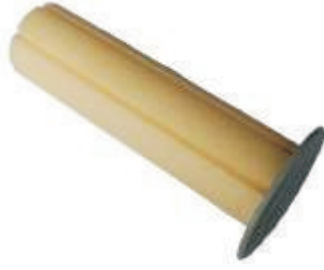
Tüm IC sıvı azot saklama dewar ve soğutucular için yedek boyun kapakları mevcuttur.